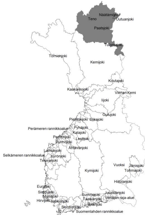
Kuva 3. Gyrodactylus salarix lta suojattu alue

käyttökielto. Asetuksessa määrätään lisäksi, että kalastusvälineiden ja -kaluston tulee olla kuivat tai desinfioidut ennen niiden käyttöä näissä vesissä.