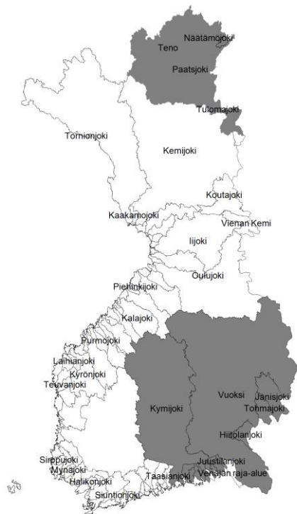
Kuva 1. BKD valvonta-alue. BKD-taudin valvonta-alueeseen kuuluvat Kymijoen, Juustilanjoen, Hounijoen, Tervajoen, Vilajoen, Urpalanjoen, Vaalimaanjoen, Virojoen, Vehkajoen, Summajoen, Vuoksen, Jänisjoen, Kiteenjoen-Tohmajoen, Hiitolanjoen, Tenojoen, Näätämojoen, Uutuanjoen, Paatsjoen ja Tuulomajoen Suomen puolella olevat vesistöalueet

Jos valvonta-alueen ulkopuolella sijaitsevan laitoksen BKD-taudin vuoksi tehtävä saneeraus on kesken uuden BKD-astuksen voimaan tullessa 1.3.2012, voi aluehallintovirasto myöntää sille luvan istuttaa kaloja valvonta-alueen ulkopuolelle 1.2.2014 asti, mikäli laitos liittyy vapaaehtoiseen BKD-ohjelmaan ja saneeraus suoritetaan loppuun aluehallintoviraston hyväksymällä tavalla.